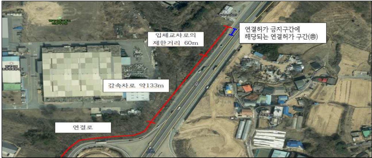
[그림 5] 입체교차로의 연결금지구간에 있는 세종특별자치시 연기면 ㉔

주: 붉은색 부분은 입체교차로의 연결금지구간을 표시. 파란색 부분은 도로연결허가를 한 구간을 표시 자료: 감사대상기관 제출자료 재구성